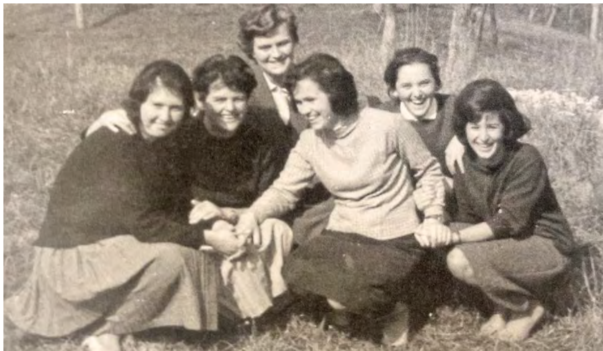
↑ Patronažne sestre, 1962

Grm M (2003). Zdravstvena kultura v Radovljici in okolico nekdaj in danes . Radovljica: Tiskarna knjigoveznica Radovljica.