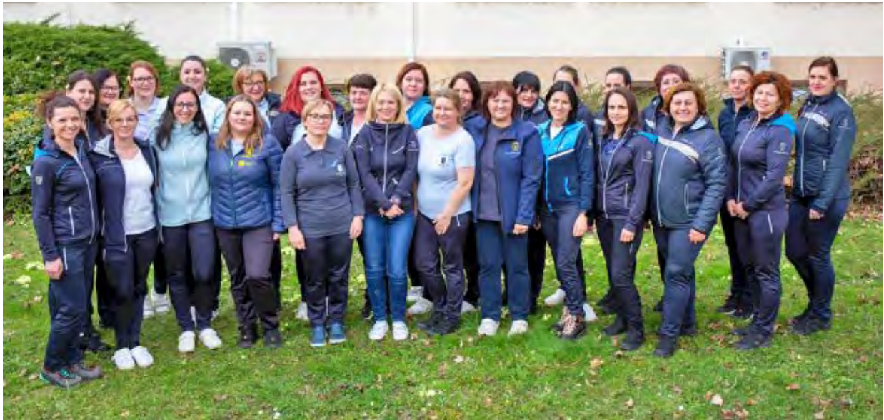
↑ Patronažne medicinske sestre ZD Celje

delo, stanovanjskimi skupnostmi, odbori Rdečega križa. Ni bilo dovolj finančnih sredstev za nabavo sodobne opreme, ne dovolj prevoznih sredstev, ne ustreznih prostorov, niti zadostnega števila kadra.