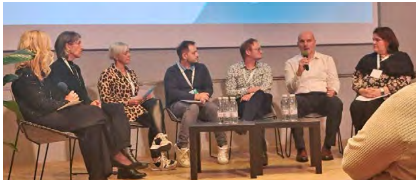
↑ Okrogla miza Ustavimo poškodbe zaradi pritiska

Aktivno smo spremljali sprejemanje zakonodaje na področju dolgotrajne oskrbe in zdravstvene dejavnosti in skupaj z Zbornico - Zvezo podali pripombe na Novoel zakona o dolgotrajni oskrbi (ZDOsk1). Udeležila sem se tudi seje v Državnem svetu na temo dolgotrajne oskrbe, kjer sem izpostavila problematiko prekrivanja in izključevanja storitev