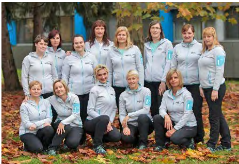
↑ Patronažno babiška služba Slovenj Gradec, 2018

Po letu 1991, ko je zakonodaja omogočila zaposlovanje večjega števila višjih medicinskih sester, se je tudi v našem zdravstvenem domu zaposlilo nove moči. Vsaka patronažna