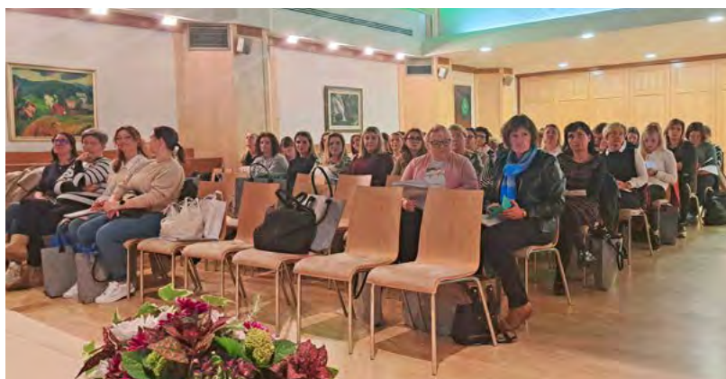
↑ Udeleženci strokovnega srečanja v Zrečah, 2024