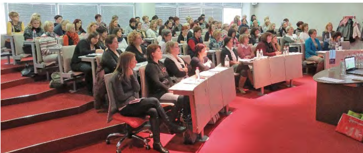
↑ Udeleženske 9. posveta vodij patronažnih služb s strokovnimi vsebinami (Vir: Sekcija medicinskih sester in zdravstvenih tehnikov v patronažni dejavnosti)