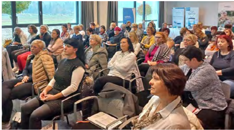
↑ Strokovno srečanje članic Združenja zasebnih patronažnih medicinskih sester, Vransko 2023

Patronažno dejavnost, katere nosilka je diplomirana medicinska sestra, se lahko kot samostojno zdravstveno dejavnost v okviru mreže javne zdravstvene službe opravlja tudi na podlagi koncesije, kar je opredeljeno v Uradnem listu RS, št. 23/05. Nadalje je v 42. členu določeno, da koncesijo za opravljanje javne službe v osnovni zdravstveni dejavnosti podeli z odločbo občinski oziroma mestni upravni organ, pristojen za zdravstvo, s soglasjem ministrstva, pristojnega za zdravje. Nosilec mora prevzeti vsa področja delovanja in izvajati polivalentno patronažno varstvo.