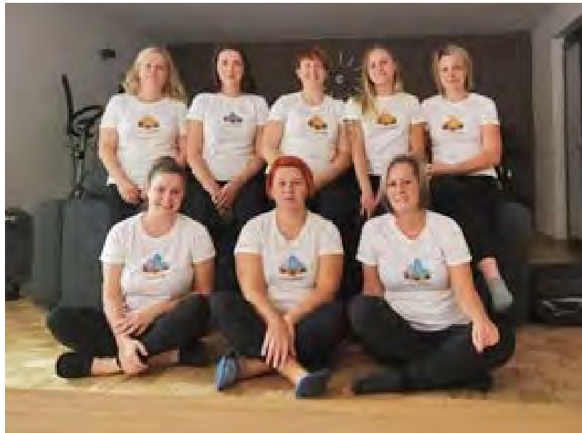
↑ Teambuilding na Krasu, 2023