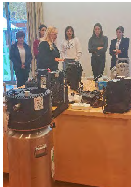
↑ Delavnica Rokovanje s koncentradorjem kisika in tekočim kisikom na pacientovem domu

Jeseni smo izpeljali dvodnevno strokovno srečanje z mednarodno udeležbo, katerega osrednja nit je bila Obravnava pulmološkega pacienta v domačem okolju . Organizacija je potekala v sodelovanju s Pulmološko sekcijo in kolegicami iz Bolnišnice Topolšica in Golnik. Odziv je bil zelo dober tako na predavanja kot na izvedene delavnice.