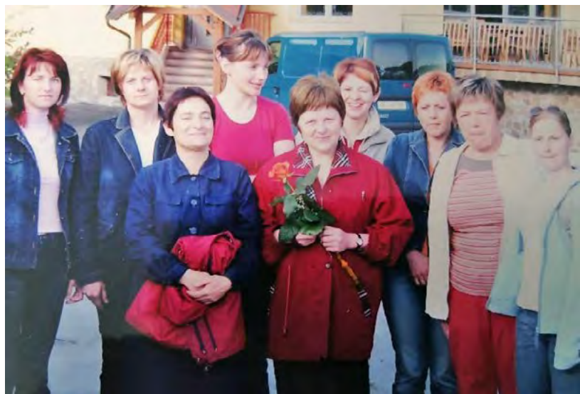
↑ Patronažne medicinske sestre na izletu na Kozje, 2005