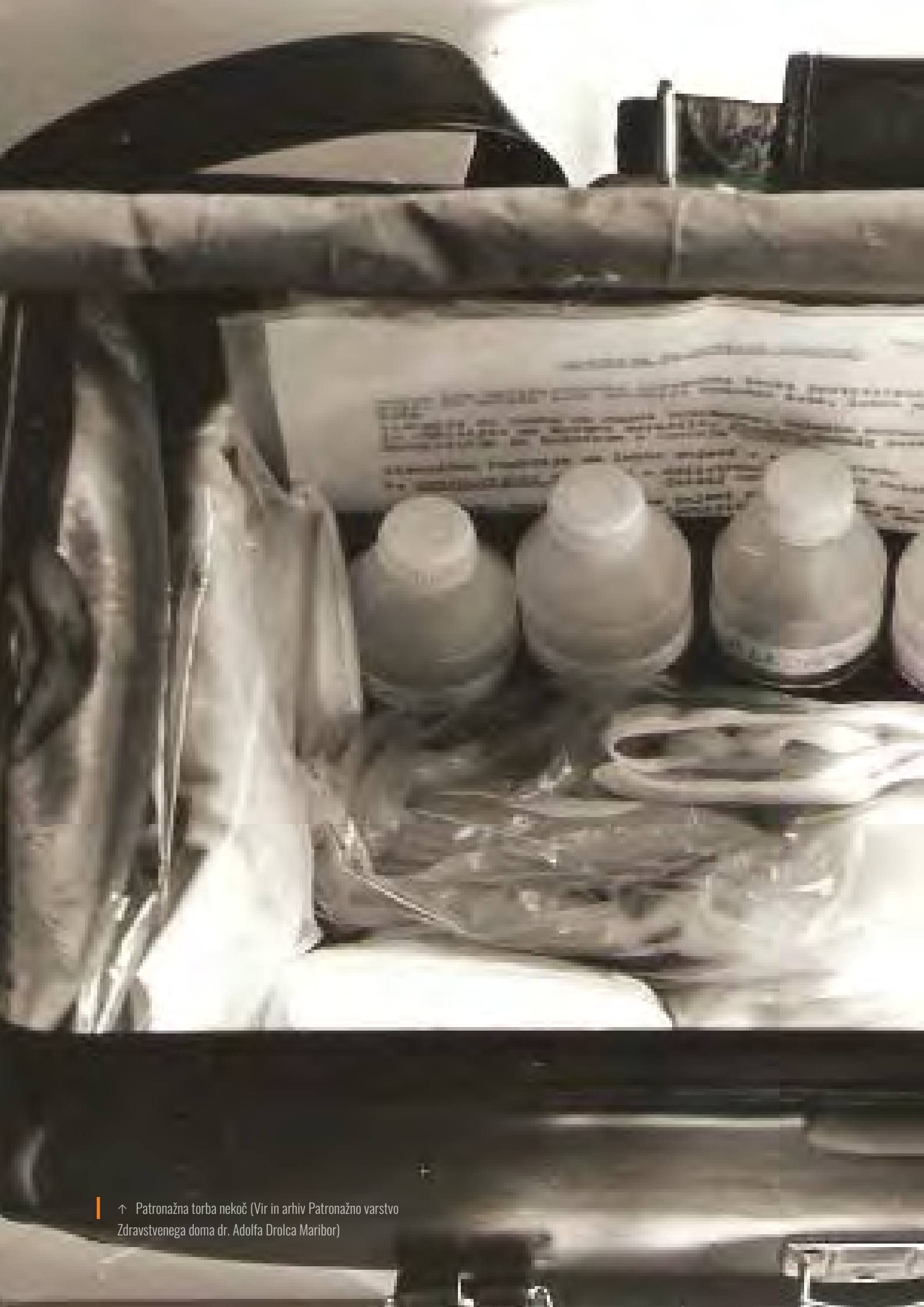
↑ Patronažna torba nekoč