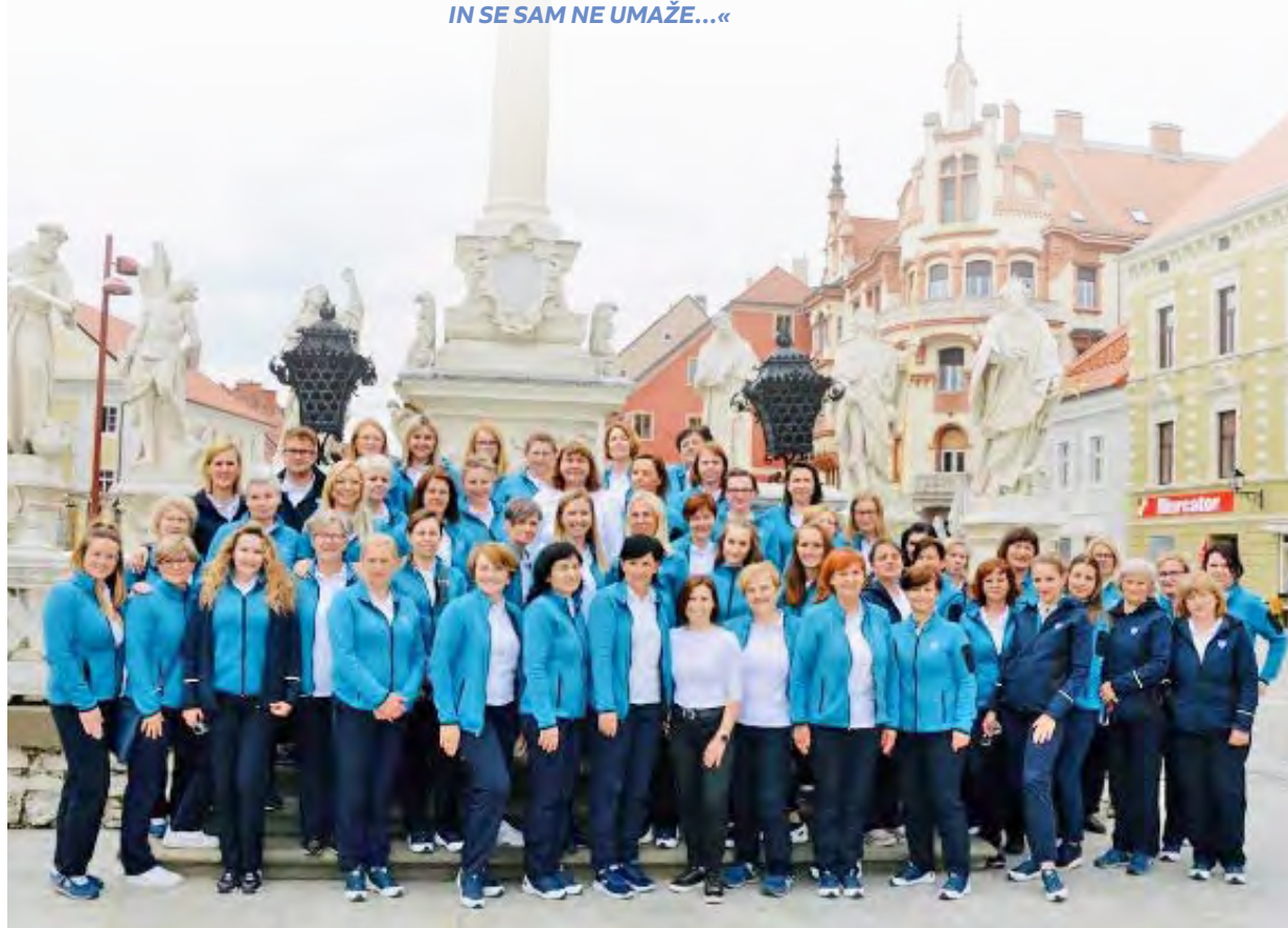
↑ Kolektiv patronažnega varstva Maribor

Patronažnega varstva ZD dr. Adolfa Drolca.