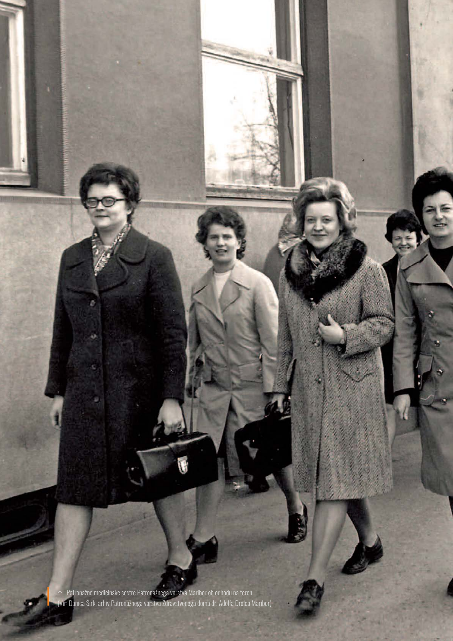
↑ Patronažne medicinske sestre Patronažnega varstva Maribor ob odhodu na teren