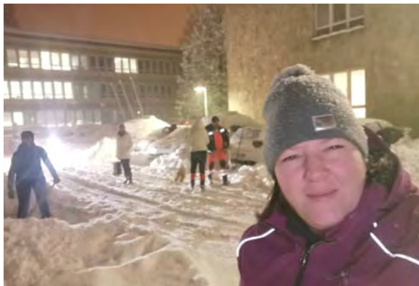
↑ Jutranje čiščenje službenih vozil pred ZD Jesenice

KO SE UZREM NA PRETEKLA LETA, BI TEŽKO REKLA, DA NAM JE BILO DOLGČAS. NEKAJ LET NAZAJ, KO SMO ŠE IMELI SNEG, JE BILA OBVEZNA JUTRANJA REKREACIJA - KIDANJE SNEGA... MALO SMO POSODOBILE VOZNI PARK, UNIFORME IN OPREMO. ZA REKREACIJO IN DRUŽENJE SMO VEČKRAT POSKRBELE TUDI V NARAVI. PROMOVIRALE SMO ZDRAVJE, PRAZNOVALE IN IMELE SPREMSTVO REŠEVALCEV V ČASU COVIDA-19. NA SPLOŠNO PA SMO SE PODPIRALE.