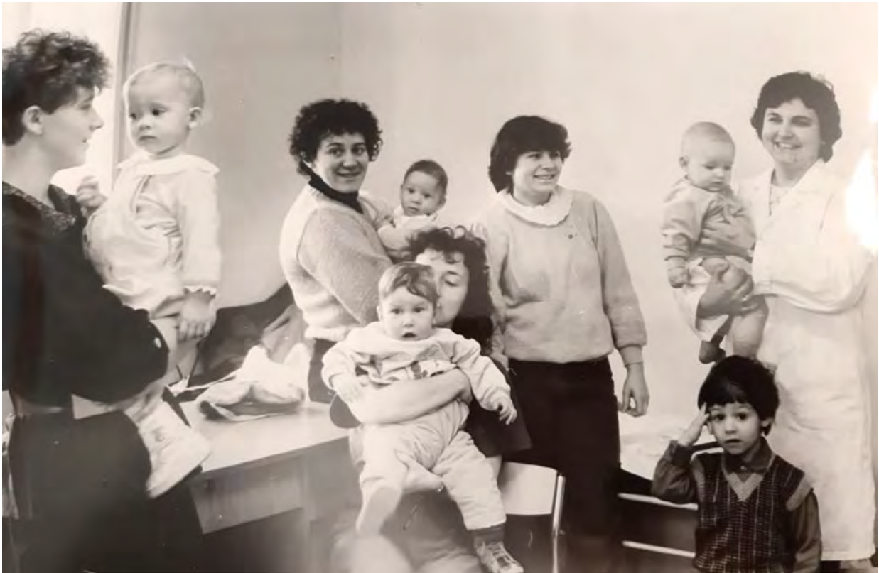
↑ Otroci in matere v posvetovalnici Ljubno ob Savinji