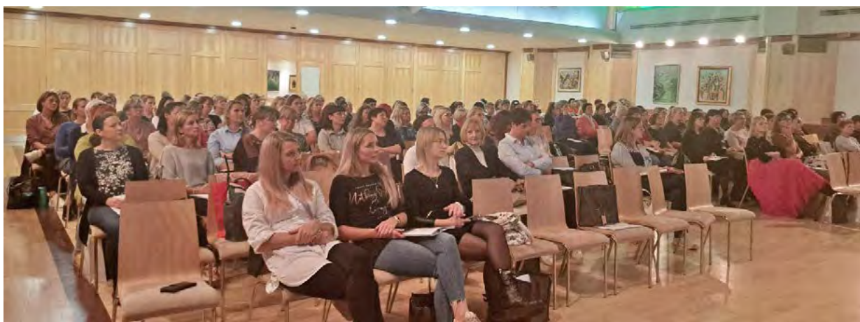
↑ Udeleženci strokovnega srečanja

in kompetenc izjemna strokovnjakinja, da nam pripravi mnenje in strokovne razlage kompetenc diplomirane medicinske sestre glede na veljavno evropsko direktivo. Tako je konec leta 2023 tudi nastal za nas izjemno pomemben dokument Kompetentnost diplomirane medicinske sestre v patronažnem varstvu za izvajanje zdravstvene