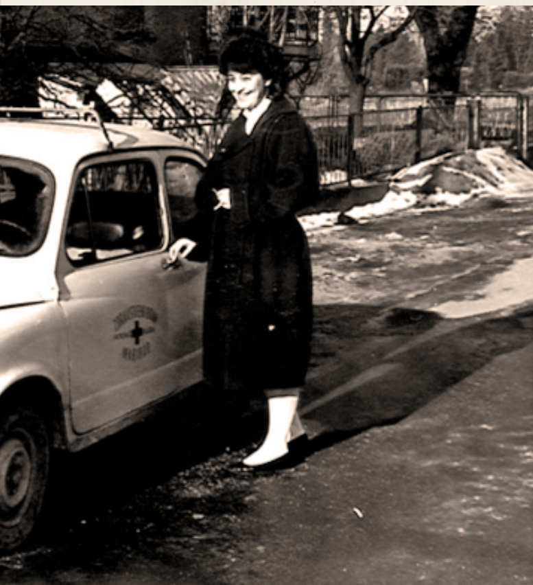
← Patronažni medicinski sestri ob službenem vozilu iz leta 1978