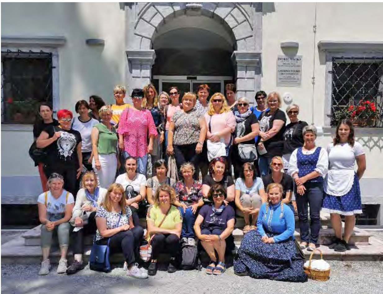
↑ Ekскурzija Združenja zasebnih patronažnih medicinskih sester, Poljanska dolina, 2024

naloga Združenja je povezovanje članic in članov za enotno nastopanje pri uresničevanju skupnih interesov ter za medsebojno podporo in informiranje. Hkrati je namenjeno