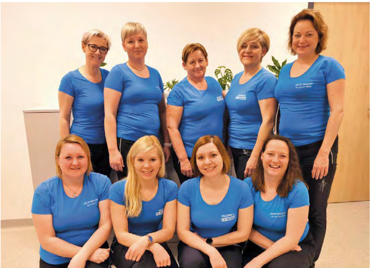
↑ Kolektiv patronažne službe Zgornjesavskega ZD Nazarje, 2025