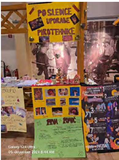
↑ Miklavžev sejem v Kolpernu

Če na kratko povzamem, lahko rečem, da se ves čas spreminjamo.