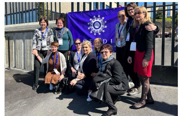
Članice delovne skupine SLONDA in avtorice prispevka pred kongresnim centrom

Udeleženke smo znova spoznale, da sta dober informacijski sistem in zapisi v standardiziranem jeziku podlaga za načrtno spremljanje našega dela. Seveda pa je nujna verodostojna interpretacija dobljenih podatkov, kar je dober začetek za raziskovalno delo v zdravstveni negi, ki lahko prinese strokovni razvoj, prepoznavnost in dobro pogajalsko stališče v širšem zdravstvenem sistemu države.