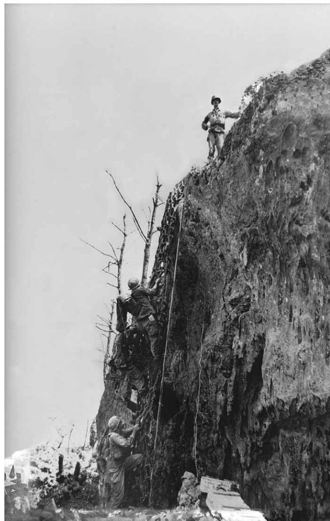
Doss na vrhu Hacksaw Ridgea

Private First Class Desmond Thomas Doss, US Army: Medal of Honor Series. [Online]. Dostopno na: https://www.nationalww2museum.org/war/articles/private-first-class-desmond-thomas-doss-medal-of-honor [18. julij, 2021].