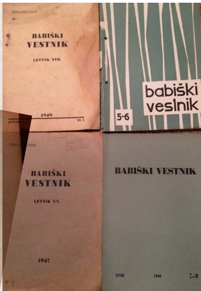
Nekaj naslovnice Babiškega vestnika

Izpolnjena želja. Doslej smo gostovale pri tujih ljudeh. Naši gostitelji v »Delavski Prilici« so bili dobri ljudje, prijazni in uslužni. Sli so nam na roko, kjer in kolikor jim je le bilo mogoče. Nikoli nam niso zavračali prošnji, nikoli nam niso dali čutiti, da nisno pri njih doma. Po vsem tem se jim moremo samo kar najbolj iskreno zahvaliti za vse, kar so nam dobrega storili. Ali vendar: Tuja streha je le tuja streha. Doma nisi in ne moreš po lastni volji gospodariti, kakor je zate prav in dobro. Naše potrebe rastejo iz dneva v dan. Pri tujih ljudeh pa ne moreš reči: to bi rad in ono zahtevam. Zadovoljen moraš biti s tem, kar ti sami in radi ponudijo, pa naj ti zadošča ali ne. Take misli ne vodile društveni odpror pri njegovem sklepu v zadnji seji odretkelega leta: Potrebujemo lastno glasilo in pripravljamo lastno, da bo list mogel iziti čimprej. Tudi da sklepate je lahko, izvršiti pa to. Premagati je bilo treba še sto in težav, predno smo mogli rešiti edaj pa naj gre list v tisk! rečno smo pa vendar prišli tudi ga in sedaj imate list v rokah. ga boste sprejele prijazno? Ali ga zavrnile, češ, nisi nam potrebnaj kajti ne le potreben, neobravavo potreben je bil. O tem biti nobenega dvoma. Tako ot je naše, pa brez lastnega ora hirati in počasi izhirati. njih more izvršiti samo list, la ne more biti govora o ebi ali nepotrebi, ampak tem, kaj bo list nudil in vzdržimo.