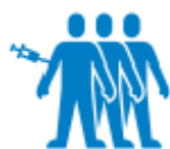
4.4 Tabela 3: Udeleženci zdravstvenovzgojnih dejavnosti po izbranih populacijskih skupinah in vsebinah, Slovenija, 2013