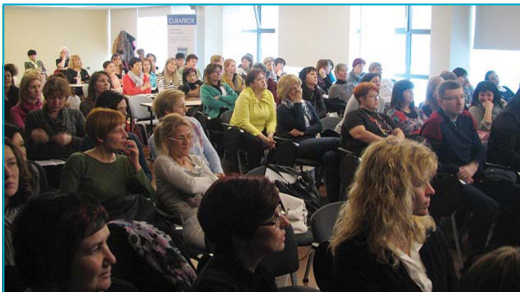
Udeleženci strokovnega seminarja

načine zdravljenja ter vzdrževanje po zdravljenju.