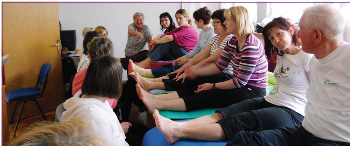
Utrinek iz praktičnega dela

Društvo MSBZT Nova Gorica je v sodelovanju z Medgeneracijskim informativnim družabnim središčem MORS v Ajdovščini pripravilo dvodnevno delavnico refleksnoconske masaže stopal, ki se je odvijala 19. in 20. aprila letos v Ajdovščini. Ker je bilo število udeležencev omejeno, so bila mesta takoj zasedena.