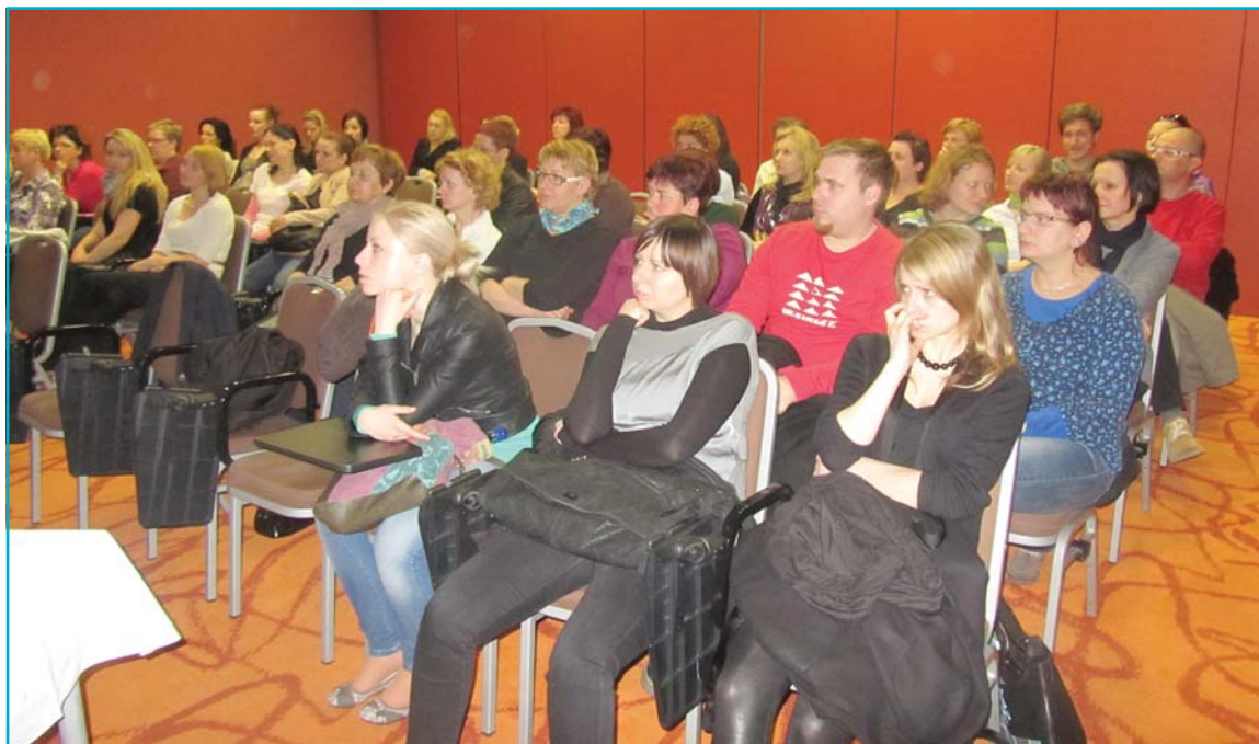
Podčetrtek, 12. 4. 2013, udeleženci strokovnega izobraževanja

Sekcija medicinskih sester in zdravstvenih tehnikov v hematologiji je organizirala strokovno srečanje 12. in 13. aprila 2013 v Podčetrtku. Glavna tema je bila preprečevanje in obvladovanje bolnišničnih okužb.