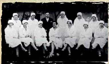
Prve konfekonierke 1923