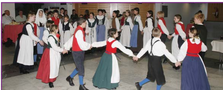
Dobrodošlico za obiskovalce je pripravila otroška folklorna skupina Kres

V imenu medicinskih sester, babic in zdravstvenih tehnikov, ki pripadamo regijskemu strokovnemu društvu, se zahvaljujem vsem sponzorjem in donatorjem, ki so omogočili, da smo našo častitljivo obletnico počastili s svečano akademijo in z izdajo zbornika. ■