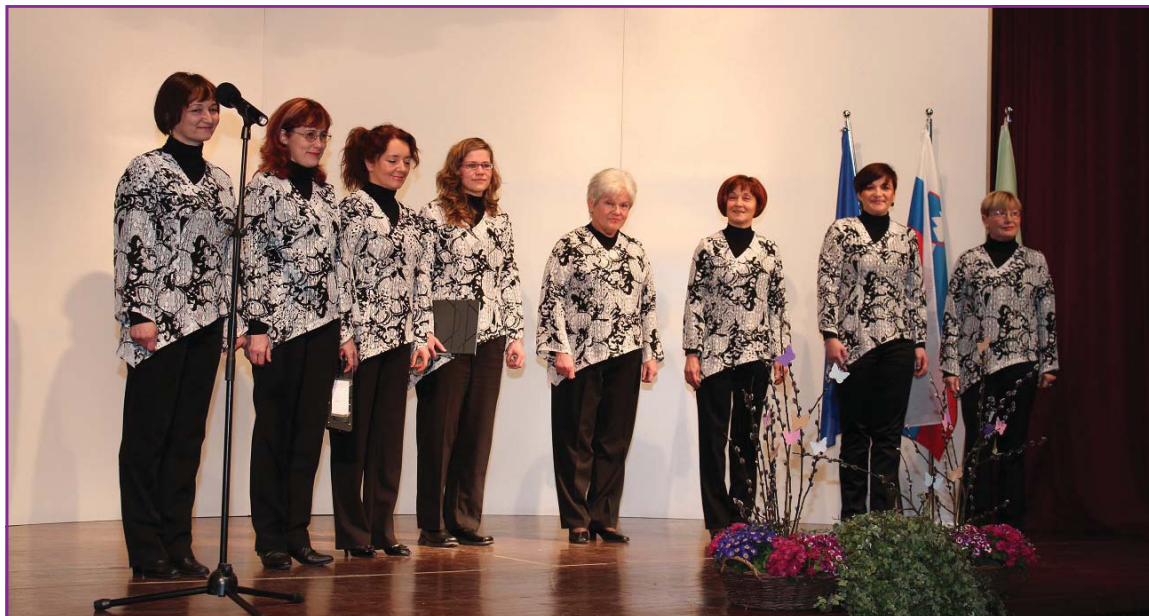
Vokalna skupina Cvet

dodatnih znanjih vpisala na Višjo šolo za zdravstvene delavce v Ljubljani in jo tudi uspešno končala. Imenovana je bila za predstojnico delovne enote patronaža in kasneje je prevzela dela in naloge glavne medicinske sestre TOZD-a Splošna medicina v Zdravstvenem centru Celje. Ob reorganizaciji je sprejela mesto glavne medicinske sestre Zdravstvenega doma Celje. Svojo poklicno kariero je končala na delovnem mestu koordinatorja, organizatorja in predavatelja na področju zdravstvene vzgoje.