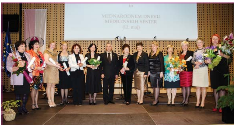
Nagrajenke z ministrom in predsednico Zbornice - Zveze