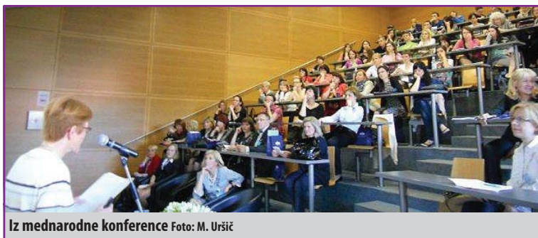
Iz mednarodne konference

Na Fakulteti za zdravstvene vede Univerze v Mariboru je od 14. do 16. maja 2013 potekala mednarodna konferenca z naslovom »Z znanjem do razvoja in zdravja« z angleškim naslovom »Knowledge brings development and health«. Mednarodno srečanje je bilo organizirano z namenom obeležitve 20-letnice delovanja fakultete. Konferenca pa je prav tako predstavljala priložnost za spodbujanje razvoja, širjenje in uporabo znanja s področja zdravstvene nege in zdravstvenih ved.