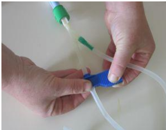
Po končanem iztoku cevje iztočne vrečke zapremo s ščipalko