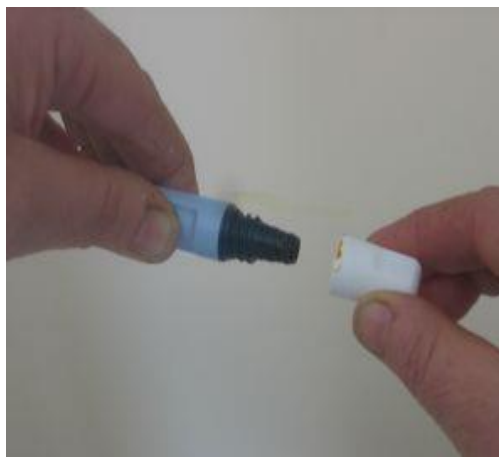
Preverimo, da je navoj na pretočnem setu zaprt; Odvijemo jodov pokrovček s pretočnega seta in ga zavržemo