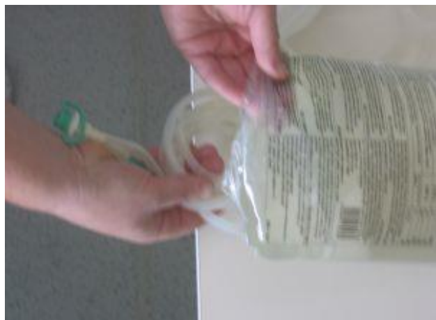
Zvito cevje položimo pod polno vrečko