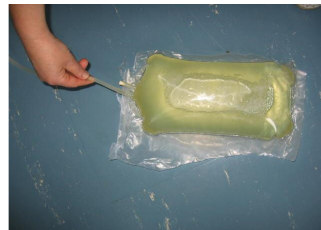
Preverimo ohlajenost cevja