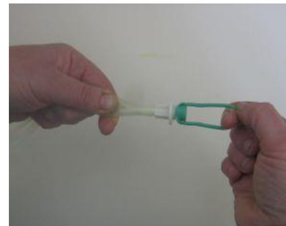
Z eno roko držimo cevje z drugo roko odstranimo barvno zaščito s konca cevja