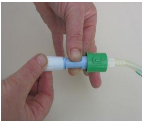
Odpremo navoj na pretočnem setu - začetek vtoka