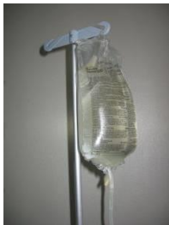
Vrečko s svežo dializno raztopino obesimo na stojalo