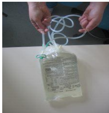
Ločimo cevje dvojne vrečke