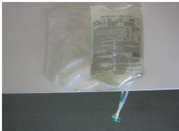
Barvna zaščita na koncu cevja visi prosto čez rob delovne površine