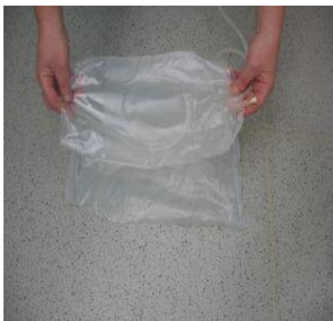
Prazno vrečko položimo na ovojnino