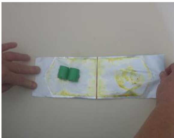
Odpremo jodovo objemko