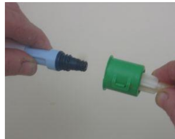
Cevje privijemo na pretočni set; Vedno zavijamo cevje in ne katetra