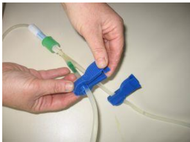
Po končanem vtoku zapremo vtočno cevko s ščipalko