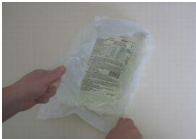
Odstranimo ovoj dvojne vrečke in ga položimo na tla; Preverimo bistrost tekočine in nepoškodovanost vrečke