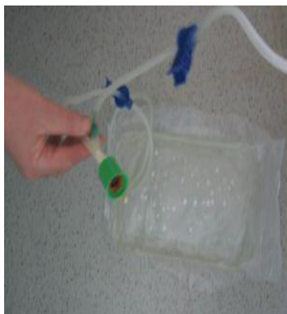
Cevje spustimo na tla