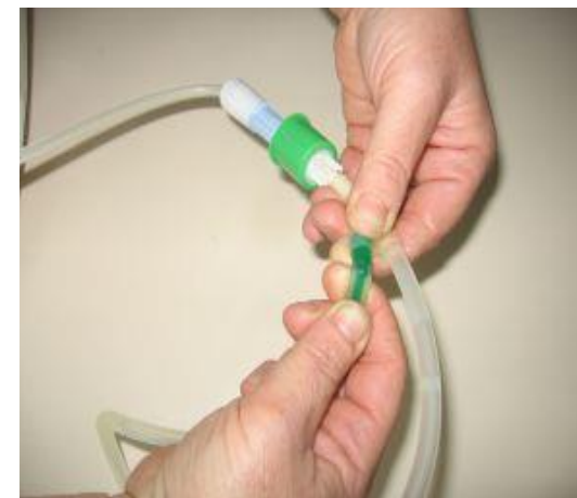
Prelomimo zelen zatič v cevju s polno vrečko