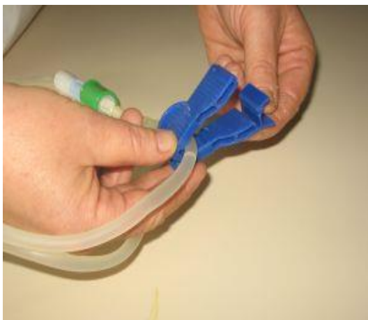
Odpremo ščipalko na iztočni cevi; Počakamo 15 sekund, da tekočina iz sveže vrečke teče v iztočno vrečko (speremo cevje), nato zapremo ščipalko