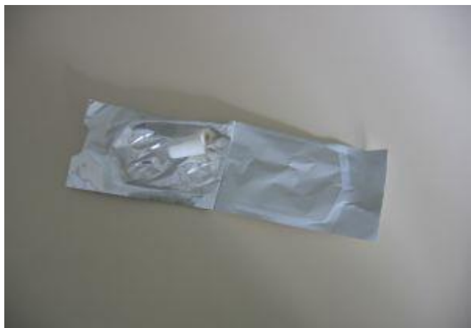
Odpremo jodov pokrovček