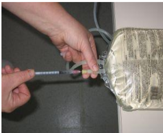
Ob prisotnosti fibrina apliciramo heparin