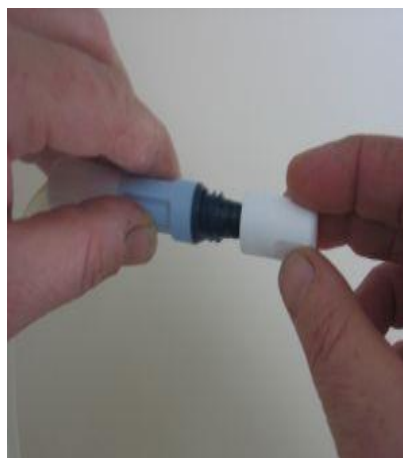
Vzamemo jodov pokrovček in ga privijemo na konec pretočnega seta