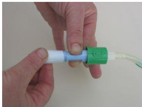
Odpremo navoj na pretočnem setu - začetek iztoka